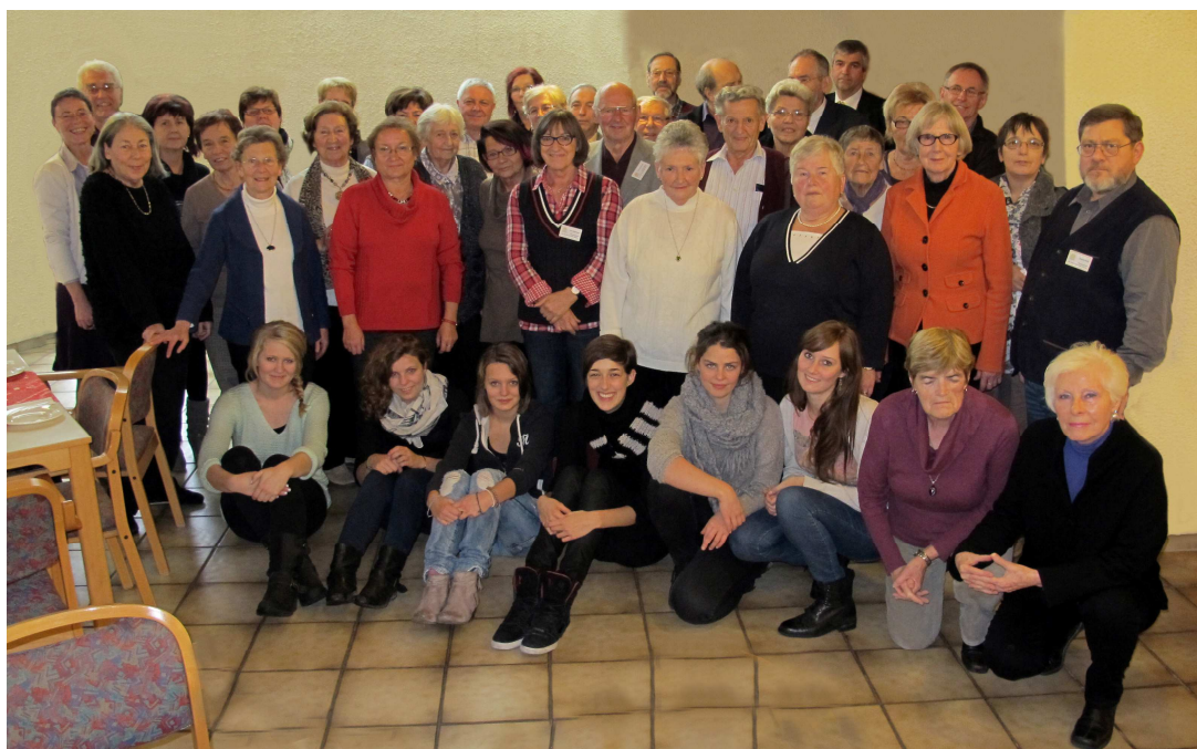
Unser Team vom Besuchsdienst im Dezember 2012