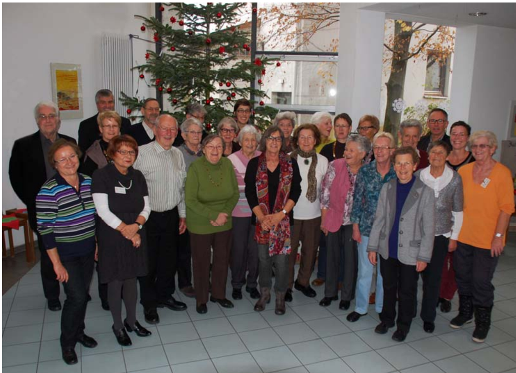
Unser Team vom Besuchsdienst im Dezember 2013

Im 2013 neu gegründeten „Netzwerk bürgerschaftliches Engagement“ der Stadt Kirchheim arbeitet die Heinrich-Sanwald-Stiftung mit. Das Netzwerk umfasst Einrichtungen aus ganz Kirchheim, in denen hauptamtlich angestellte Mitarbeiter mit ehrenamtlich Engagierten zusammenarbeiten. Es dient dem fachlichen Austausch und der institutionsübergreifenden Kooperation.