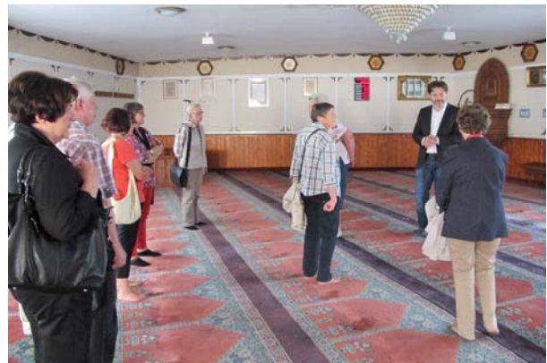
Besichtigung in der Moschee

2013 fanden wieder regelmäßig Treffen unseres Besuchsdienstes statt. Mit dem Thema „Glück und Segen“ begannen die Sanwald-Sterne das Jahr. Austauschtreffen, der jährliche Grillabend, die Fortbildungsthemen „Umgang mit unruhigen Heimbewohnern“ und „Lebensmittelkennzeichnung“ und der beliebte Filmabend folgten. Ein besonderer Termin war der Besuch in der Kirchheimer Moschee in der Lohmühlgasse. Dort erfuhren die Sanwald-Sterne viel Wissenswertes über die Moschee, den Ablauf der Gebete und konnten Fragen rund um den Islam stellen.